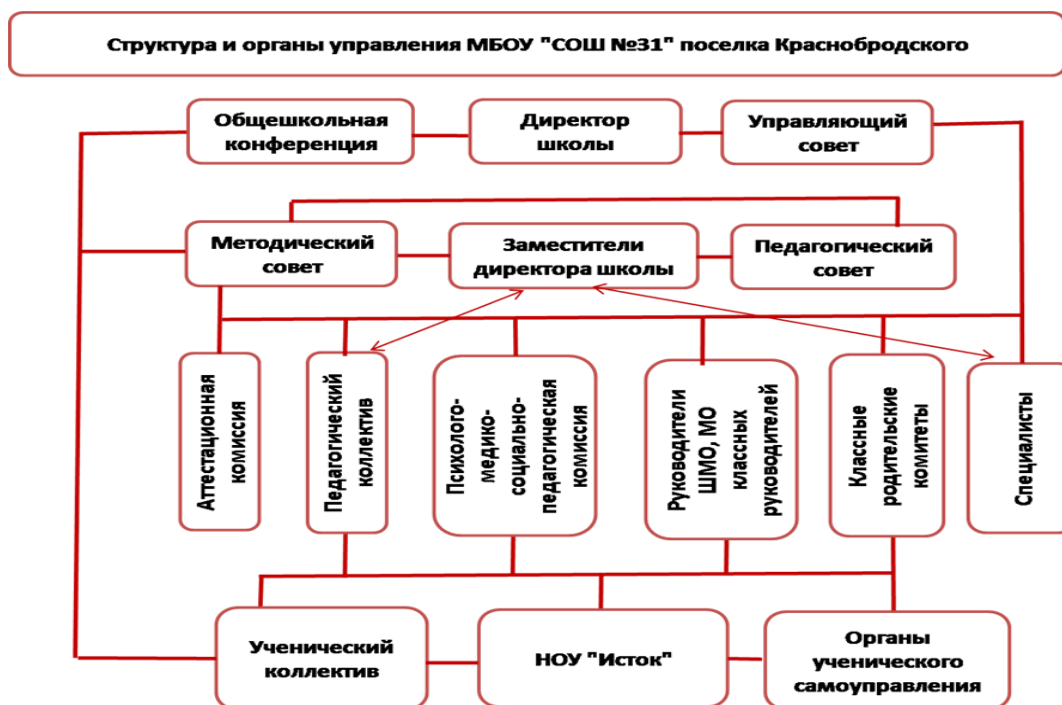
Рис. 1. Структура и органы управления

Структурные подразделения, филиалы, представительства отсутствуют.